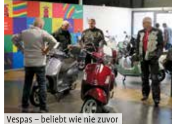
Vespa - beliebt wie nie zuvor

Weltenbummler, die mit extrem weitgesteckten Reisezielen, von spannendsten Erlebnissen zu erzählen haben. Natürlich wurden auch wieder Probefahrten angeboten, auch mit batteriebetriebenen Fahrzeugen – so konnten Elektro-Freaks, den bereits im vorherigen Heft vorgestellten