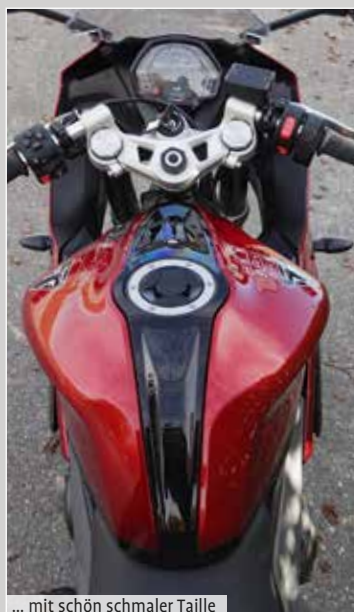
... mit schön schmaler Taille

Die toppgriffigen Bremszangen verzögern sehr gut und bestens dosiert. Hier gibt es absolut keinen Grund zur Kritik. Spitze funktioniert auch das feinregeln, kaum spürbare ABS! Wem die Triumph 660 in der