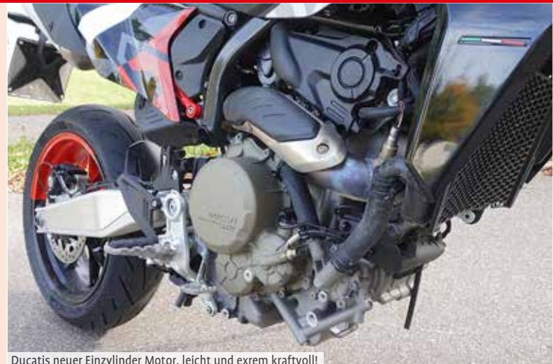
Ducatis neuer Einzylinder Motor, leicht und extrem kraftvoll!

ker ist breit, für eine sehr sensible Einlenk- und Kurvenkontrolle. Der Spiegelblick geht in Ordnung und es bleibt der Druck auf den Starter ... Wow, was ist das? Ein ruppiger, aggressiver Sound – den einen Zylinder hört- und spürt man. Das klingt und fühlt sich nach Leben an, nach kraftvollen sportlichen Genen ohne Kompromisse. Kupplung, 1. Gang und wir ballern los, im wahrsten Sinne des Wortes ... Komfort, eher nicht so, dafür etwas Ruckeln und Bockeln, bis 3.000 Touren