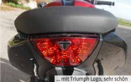
... mit Triumph Logo, sehr schön