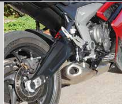
Perfekt platzierter Unterflurschalldämpfer

druckend und fühlt sich nach deutlich mehr, als 95 PS an. Die Daytona schiebt schier unaufhörlich und sehr gleichmäßig bis in die oberen Drehzahlen nach und bleibt damit gut berechenbar. Das breite Drehzahlband bis über 12.000 Umdrehungen, lässt in Verbindung mit dem Schaltassistenten ein wahres Rennfeeling aufkommen. Der Sound