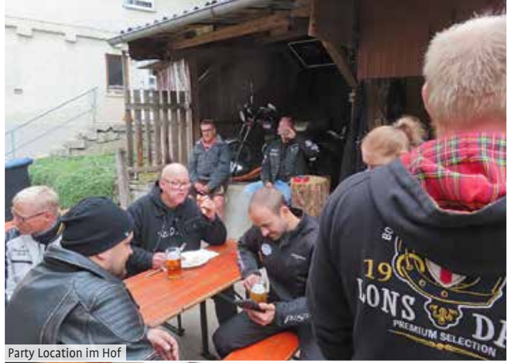
Party Location im Hof

MUNDING BEWEGT DIE REGION AUTOHAUS MUNDING GMBH RIEDLINGEN • Opelstraße 1