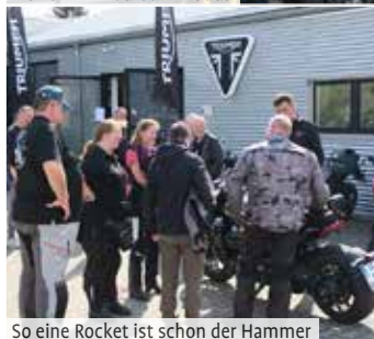
So eine Rocket ist schon der Hammer