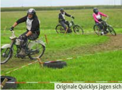
Originale Quicklys jagen sich