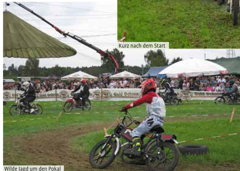
Wilde Jagd um den Pokal

Zu jedem Rennen melden sich neue Piloten an, die versuchen, an die Rundenzeiten der Teilnehmer die schon seit Jahren dabei sind, heran zu kommen.