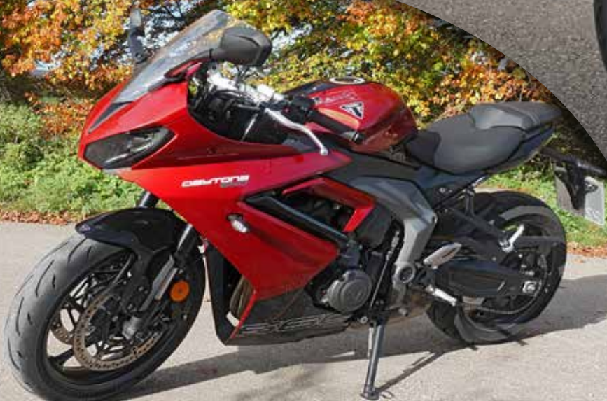
Triumph 660 Daytona auf d'r Alb