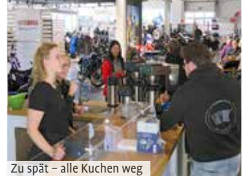
Zu spät – alle Kuchen weg

von der Sendener Wasserwacht übernomme. Die Kuchen- theke, war für mich persönlich leider schon geschlossen, da alles schon am frühen Nach- mittag ratzeputz aufgefuttert war – tja, wer zu spät kommt, den bestraft das Leben, wie es so schön heißt! Den Leuten