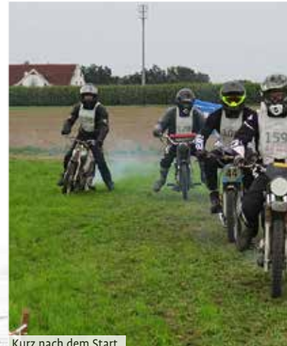
Kurz nach dem Start

Das Quicklyrennen, das der MC Weihungstal jedes Jahr veranstaltet, wird es vermutlich bis in alle Ewigkeiten geben, so begeistert sind die Zuschauer und Teilnehmer davon.