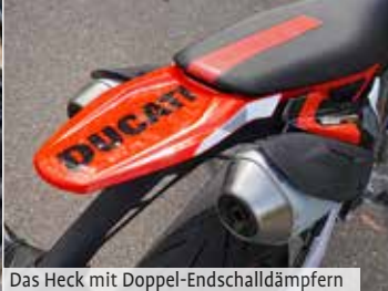
Das Heck mit Doppel-Endschalldämpfern

Wheelies usw. kaum Erfahrung habe aber ich kenne jemanden, der das aus dem FF beherrscht und ich weiß, worauf es bei solchen Sportgeräten ankommt – er hätte sicher seine wahre Freude an dieser Ducati!