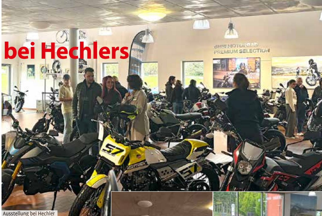
Ausstellung bei Hechler

Am 28. September fand bei BMW Motorrad Hechler in Dettingen ein kleines, sehr feines Herbstfest statt. Ein paar Biertische und Bänke, etwas zu Essen und Trinken, mehr braucht man eigentlich nicht, um Motorradfahrer zufrieden zu stellen. Die meisten Besucher standen sowieso eher um die Motorräder herum und diskutierten