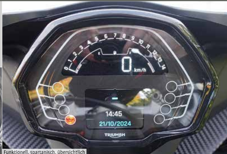
Funktionell, spartanisch, übersichtlich

druckend und fühlt sich nach deutlich mehr, als 95 PS an. Die Daytona schiebt schier unaufhörlich und sehr gleichmäßig bis in die oberen Drehzahlen nach und bleibt damit gut berechenbar. Das breite Drehzahlband bis über 12.000 Umdrehungen, lässt in Verbindung mit dem Schaltassistenten ein wahres Rennfeeling aufkommen. Der Sound