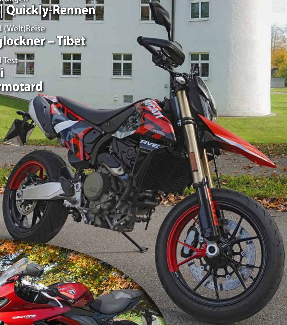
Ducati Hypermotard Mono AVE, vor dem Schloss in Glött