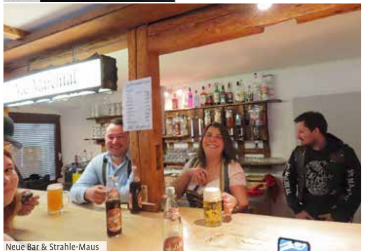
Neue Bar & Strahle-Maus

gemütliche, zum Teil auch überdachte Sitzplätze. Kulinarisch war der Club bei seinem Oktoberfest wieder ganz vorn dabei. Neben den obligatorischen Weißwürsten mit Brezeln, gab es einen selbst hergestellten "Obazter" mit Rettich, Laugenstange und Debreziner, sehr deftig und bestens gelungen! Das neue Clubhaus kam bei den zahlreichen Besuchern sehr gut an. Das waren nicht nur mehrere MC's, sondern auch Bürger aus Marchtal und Umgebung, da sich der sympathische "MC