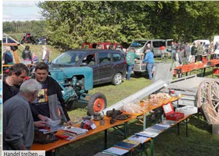
Handel treiben ...