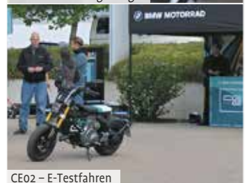
CE02 – E-Testfahren

BMW CE02, auf einem Parcours, auf seine Wendigkeit testen. Die Angebote bei den Fahrer-