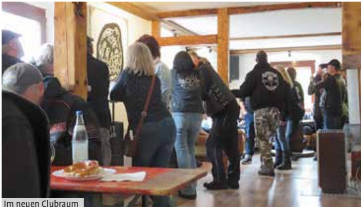
Im neuen Clubraum