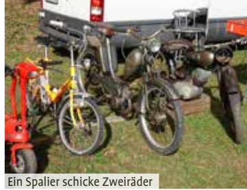
Ein Spalier schicke Zweiräder