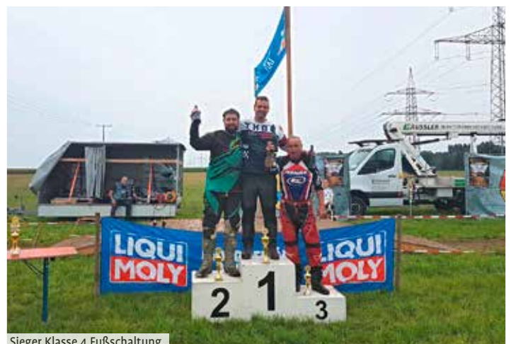
Sieger Klasse 4 Fußschaltung

Gastronomie lief permanent auf Hochtouren, jedenfalls musste ich immer anstehen, wenn ich Nachschub brauchte :-) Auch wenn das Teilnehmerfeld