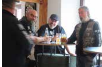
Präsi MC Marchtal (li. mit breitem Scheitel)