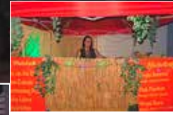
Die Ruhe vor dem (An)Sturm

am geringen Bekanntheitsgrad der "Label Z", denn die letzten Jahre bescherten die Rockabende immer ein volles Haus. Trotzdem wünschen wir dem Club ein schönes Weihnachtsfest und einen guten Start in 2025 !