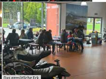
Das gemütliche Eck

das Wetter nicht so überragend aber das kennen wir Biker ja inzwischen ... wir haben gelernt, damit umzugehen.