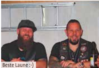
Beste Laune :-)

in unserer Gegend relativ unbekannt sind, da sie aus dem Augsburger Raum kommen. Schon bei den ersten Songs war jedem