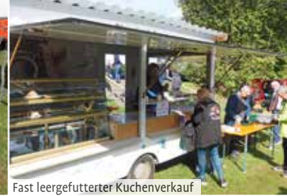
Fast leergefütterter Kuchenverkauf

Schon früh morgens, am 29. September, füllte sich der „alte Sportplatz“ mit Fahrzeugen und Verkaufsständen. Die Bulldog- und Oldtimerfreunde Kemnat Mindeltal sorgten für die entsprechende Infrastruktur vor Ort und eine reibungslose Veranstaltung.