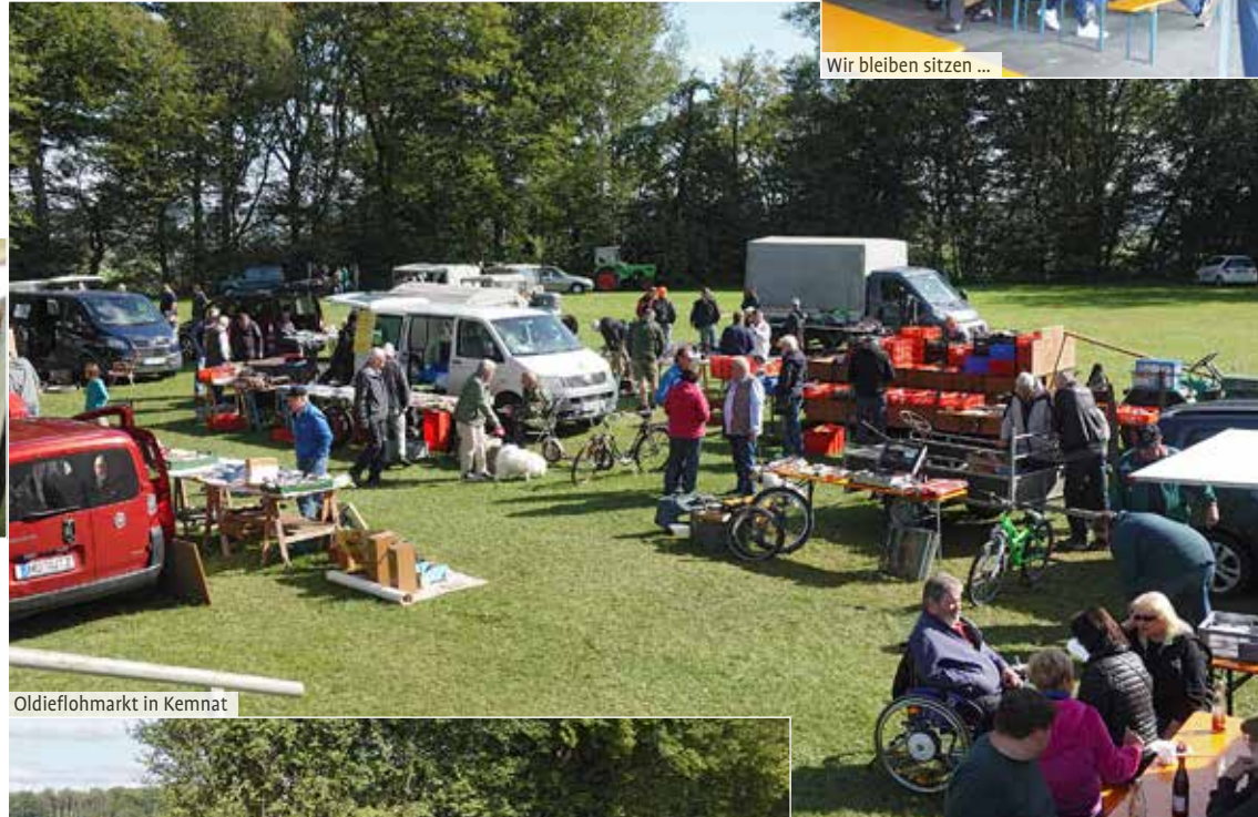
Oldieflohmarkt in Kemnat

war wieder richtig was los. Die Vereinsleute freute es natürlich, dass das Wetter mitspielte und ihr Hobby, immer noch als das Richtige bestätigt wurde :-) Zu Essen gab's natürlich auch ausreichend, nur die Kuchenauswahl war wieder recht schnell