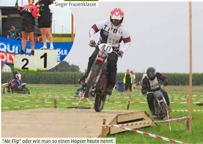
"Air-Flip" oder wie man so einen Hopper heute nennt