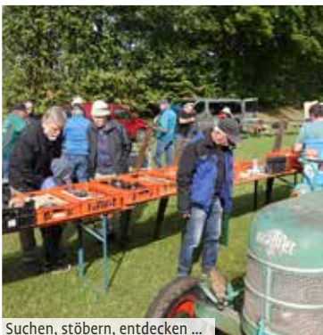
Suchen, stöbern, entdecken ...