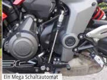
Ein Mega Schaltautomat

tut ebenfalls sein Bestes dazu. Mit einer 660er Daytona kann man sich schon auch mal auf einer Rennstrecke zum Training anmelden und blicken lassen. Man kann aber auch gemütlicher. Mit den 3 Fahrmodi (Sport, Straße und Regen) machen auch stressfreies Touren und lockere Ausfahrten richtig Spaß. Traktion, ABS und die Gasannahme werden den gewählten Umständen angepasst. Es ist auch "unten herum" ausreichend Druck vorhanden.