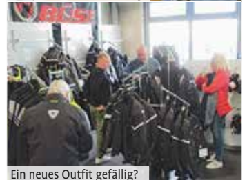
Ein neues Outfit gefällt?