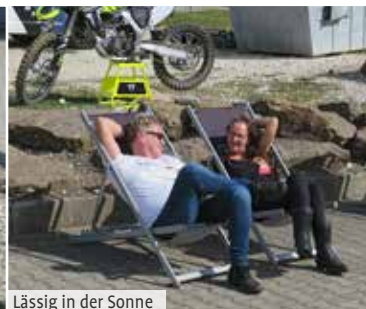
Lässig in der Sonne