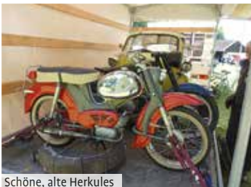
Schöne, alte Herkules

F ast zeitgleich, trafen auf dem doch eher kleinen, regionalen Teilemarkt, die ersten Besucher ein. Der Platz war bald gut belegt, mit Ständen und Gästen aus nah und fern und im schönen Kemnat