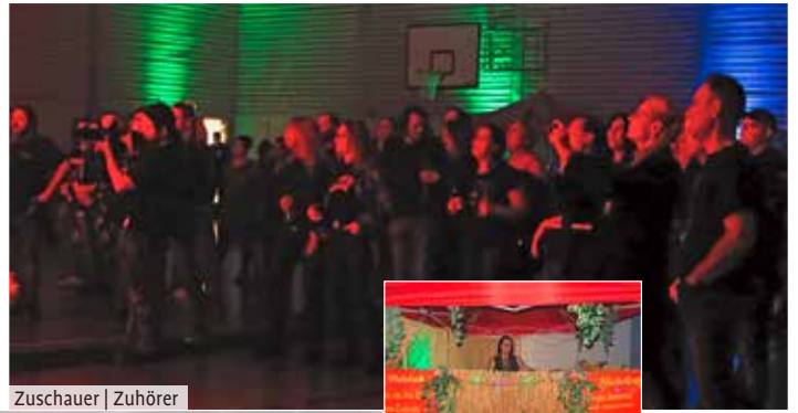
Zuschauer | Zuhörer

klar, dass sich diese Investition gelohnt hatte. Mit einer quirligen, stimmungsvollen Frontfrau rockte die Band die Halle und riss die Besucher mit. Die Weihungstaler hätten sich über ein paar mehr Besucher gefreut, da noch einiger Platz vor der Bühne, bzw. in der Halle war. Vielleicht lag es auch