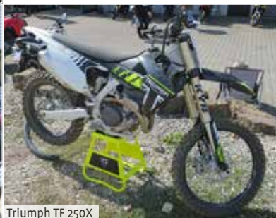
Triumph TF 250X