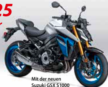
Mit der neuen Suzuki GSX S 1000