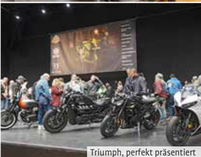
Triumph, perfekt präsentiert