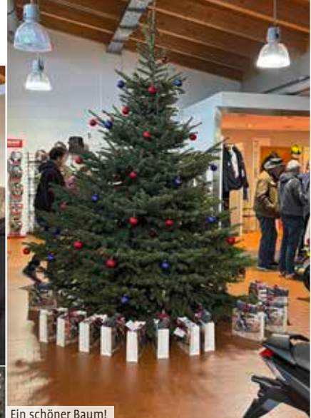
Ein schöner Baum!