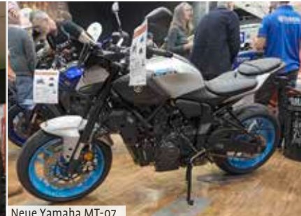
Neue Yamaha MT-07

lichkeiten werden nur durch die Eintrittspreise finanziert. Gut, 10 € sind nicht gerade ein Schnäppchen, aber dafür ist das Parken kostenlos. Woanders ist alleine