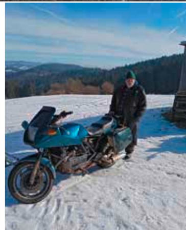
Das Zelt steht, die Feldküche ist bereit; Jetzt sollte nichts mehr schief gehen.

Kein weiterer Gast ist außer ihm zu sehen.