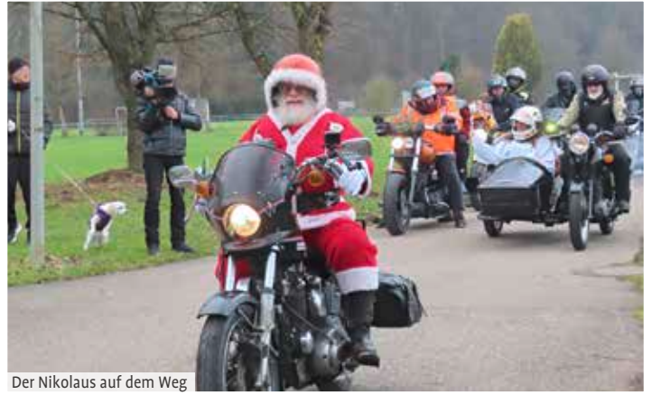
Der Nikolaus auf dem Weg