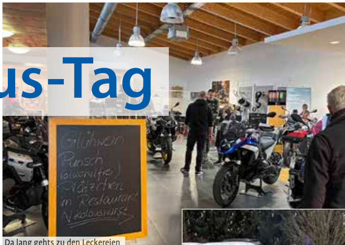
Da lang gehts zu den Leckereien

Die Weihnachts- oder Nikolausfeier 2024 bei BMW Hechler war besser besucht, als im Jahr zuvor. Vor allem waren mehr Besucher mit dem Mo-