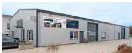
Sie finden uns an der A7, Ausfahrt Illerberg/Vöhringen bei der OMV Tankstelle

Unfallgutachten · Unfallrekonstruktion · KFZ-Bewertungen · Beweissicherungen · Vermessung und Verzugsprüfung von Motorradrahmen