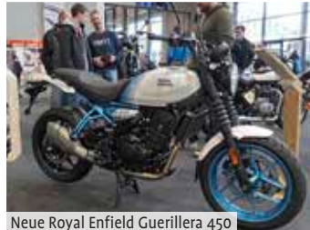
Neue Royal Enfield Guerrilla 450

und Indoor-Rennstrecken hergerichtet und die Fahrerlager fanden dort auch wieder ihren Platz. Kalt, laut und ungemütlich war es dort aber auch imposant und aufre-