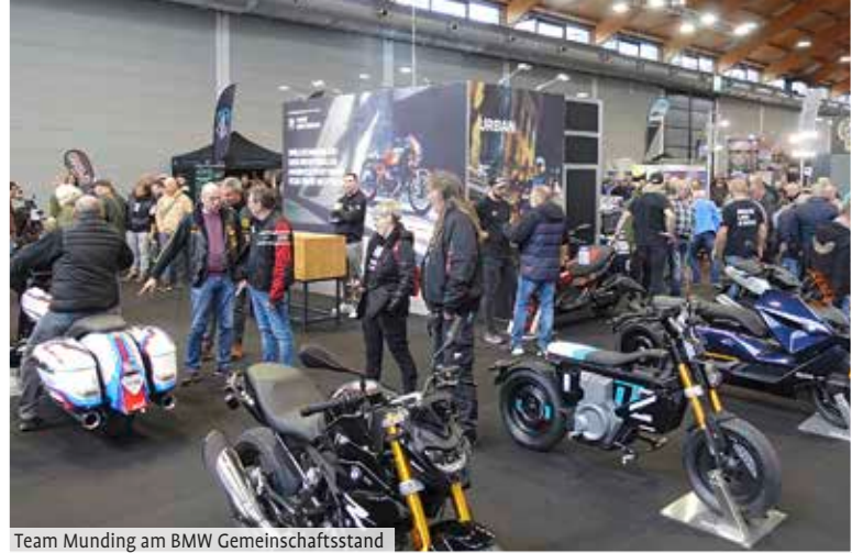
Team Munding am BMW Gemeinschaftsstand

zu erwarten sind. Somit erhoffte ich mir einen drängelnden Rundgang und Fotos ohne ständig Personen vor den Motiven zu haben. Alle Hallen auf der rechten Seite waren für Parcours, Stuntshows