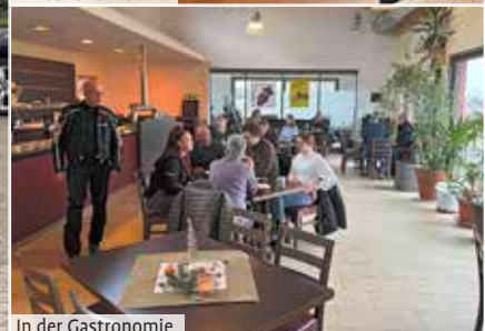
In der Gastronomie

torrad gekommen, da das Wetter prima mitspielte. Trotz der milden Temperaturen war am