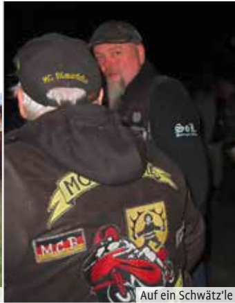
Auf ein Schwätzle