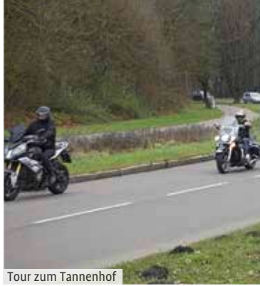
Tour zum Tannenhof