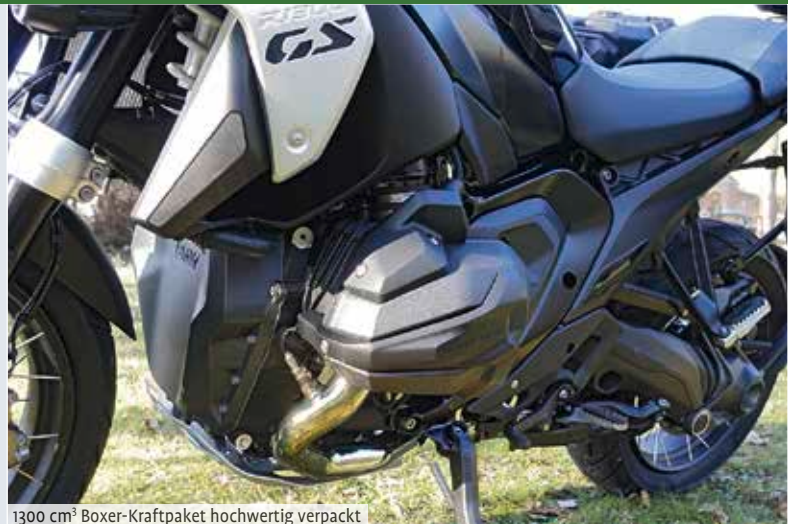
1300 cm³ Boxer-Kraftpaket hochwertig verpackt