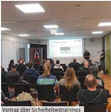
Vortrag über Sicherheitstrainings

Bekleidungs- und Zubehörhändler, sowie die vielen kleinen Stände mit Accessoires. Sämtliche Motorräder wurden von den umliegenden, regionalen Händlern herangeschafft und ausgestellt. Jeder Einzelne trägt hier dazu bei, eine so großartige Veranstal-