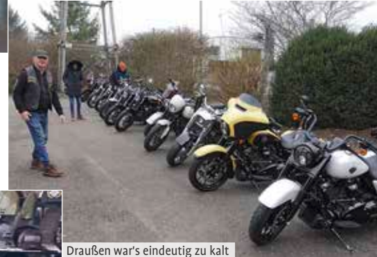
Draußen war's eindeutig zu kalt

etwas zu tun, nahmen sich die Zeit, mit der Kundschaft zu plaudern oder sie zu beraten. Ein lockeres, saugemütli-