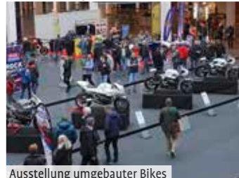
Ausstellung umgebauter Bikes

Händler, die das wieder alle in Eigenregie gestemmt haben – Hut ab. Soweit war es wieder eine tolle Veranstaltung und ich hätte auch gerne noch etwas mehr Auswahl bei den Bildern gehabt, aber ich hatte als „Profi“ mal wieder nur