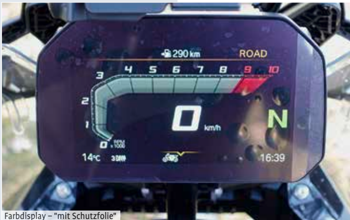
Farbdisplay – "mit Schutzfolie"

Wie sich dieses automatisierte Schaltsystem bei extremen Enduroeinlagen bewährt, muss noch erprobt werden aber für Tagesausfahrten, bis auf ausgedehnte Motorradreisen, ist es mit Sicherheit ein großer Kom-