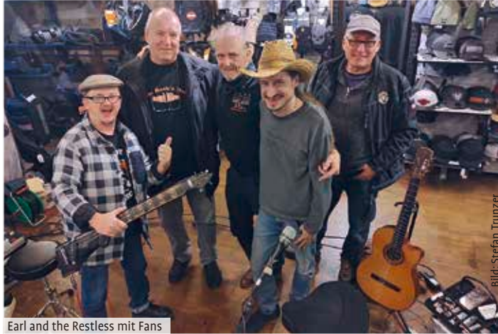
Earl and the Restless mit Fans

bewirtschaftete wieder die Gäste und zur musikalischen Unterhaltung gab's von Earl and the Restless wieder guten Sound auf die Ohren, das passt bestens zusammen, wenn die Jungs mit ihren Gitarren, Mundharmonika