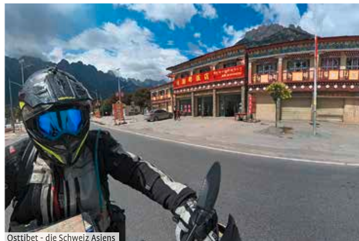
Osttibet - die Schweiz Asiens