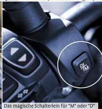
Das magische Schalterlein für "M" oder "D"

bremse, legt per Fußschaltung den ersten Gang ein, löst die Bremse und mit etwas Gas gehts schon los. In Stellung "D", schaltet die BMW beim Beschleunigen weiter hoch in die nächsten Gänge. Somit hat die linke Hand nichts zu tun und wenn man nicht daran denkt, greift sie ins Leere. Nimmt man das Gas zurück, dann schaltet die GS selbst-