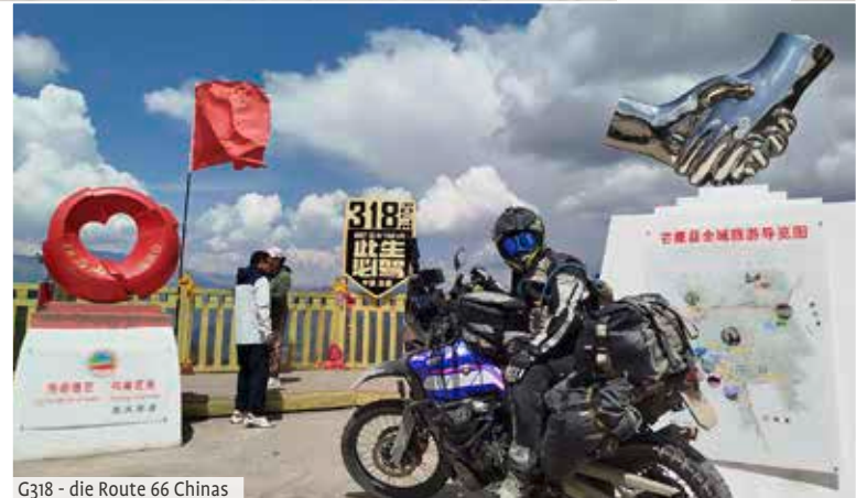
G318 - die Route 66 Chinas

Es warten 150 Kilometer Gravel bis Naryn. Die schmale Linie auf der Karte entpuppt sich als eine Motorradstrecke der Extraklasse. Die Bergpiste windet sich hinauf zum 3.262 Meter hohen Makmal-Pass. Auf den letzten Metern zur Scheitelhöhe entfaltet sich ein atemberaubendes 360-Grad-Panorama: Majestätische Vier- und Fünftausender rahmen die endlosen Weiten der Fergana-Ebene. Das Licht der Mittagssonne lässt die Halbwüs-