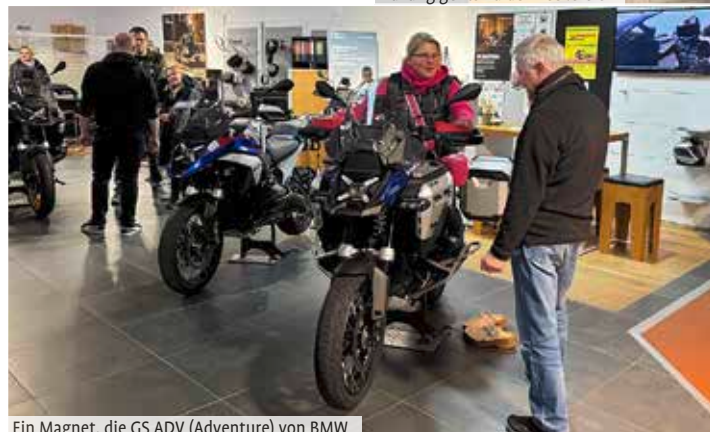
Ein Magnet, die GS ADV (Adventure) von BMW