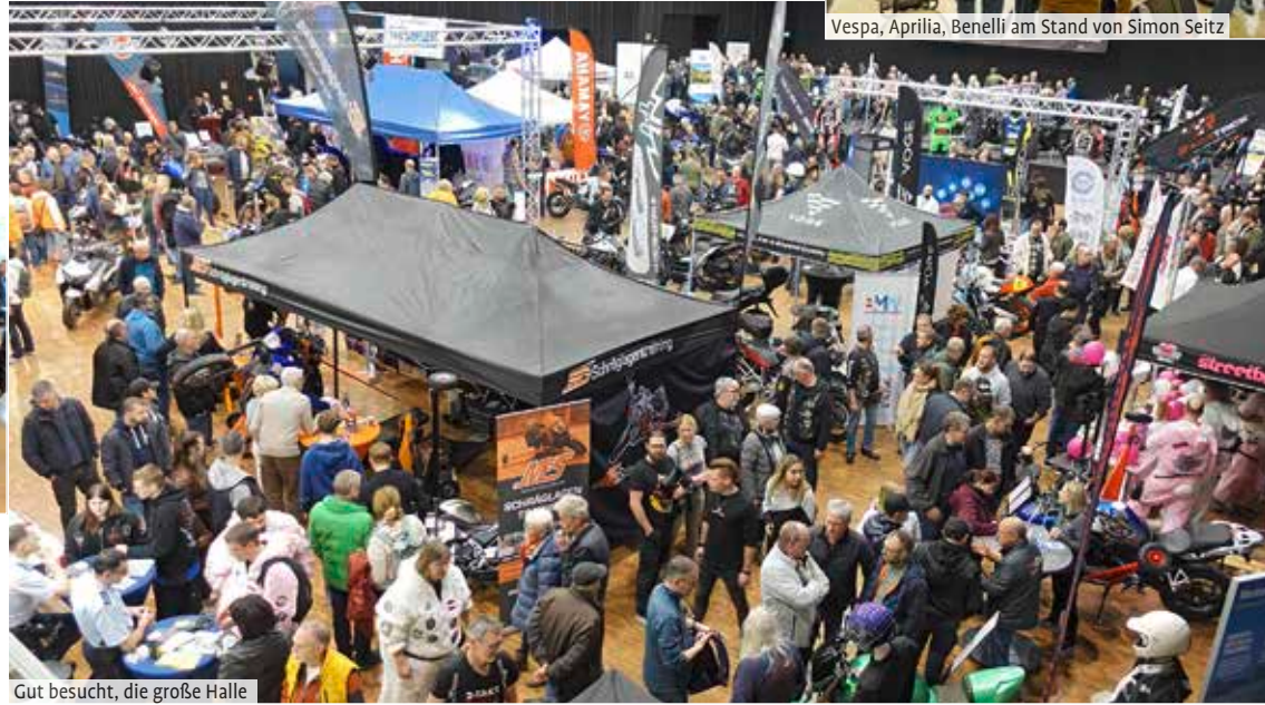
Gut besucht, die große Halle

tung auf die Beine zu stellen! Das Konzept gibt Bernd Hudelmaier Recht. Die Stände auf der Messe sind für die Aussteller kostenlos,