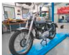
Wir erstellen Oldtimergutachten

89269 Vöhringen An der alten Ziegelei 10 Tel. 07306.35730-0