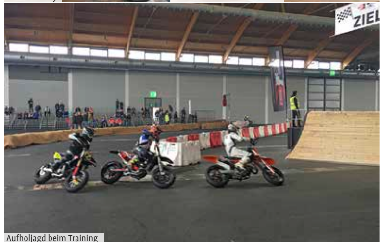
Aufholjagd beim Training

Motorräder. Es waren so ziemlich alle „wichtigen“ Marken vertreten aber eben nicht durch die Hersteller selbst, sondern durch deren