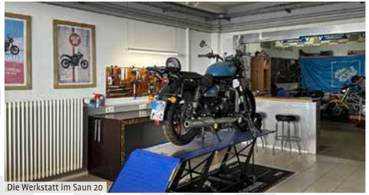
Die Werkstatt im Saun 20