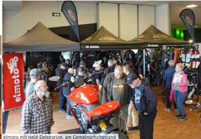
elmoto mit Held-Delegation, am Gemeinschaftsstand

nur so können es sich viele leisten, dabei zu sein. Lediglich den Strom müssen sie zum Selbstkostenpreis bezahlen. Die Räum-