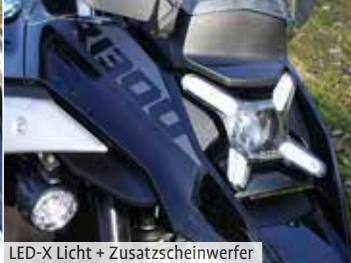
LED-X Licht + Zusatzscheinwerfer