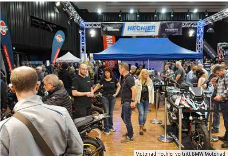
Motorrad Hechler vertritt BMW Motorrad